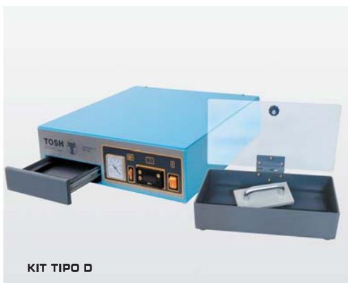
KIT TIPO D