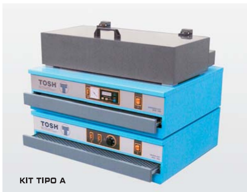
KIT TIPO A

In relation to the developing procedure and the size of the plate, Tosh has put into different kits the single equipments, to make easier their choice.