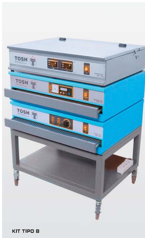
KIT TIPO B