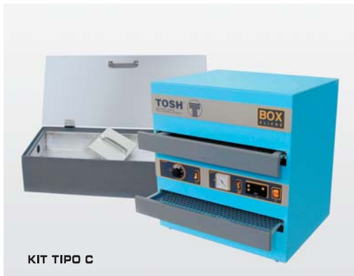
KIT TIPO C